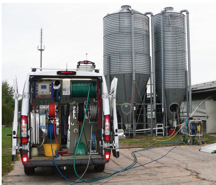
Рисунок 2. – Общий вид передвижного пункта для внутренней очистки силосов компании Silo-RoBoFox (Германия)

– полную безопасность для операторов, так как применение оборудования исключает необходимость присутствия человека внутри силоса;