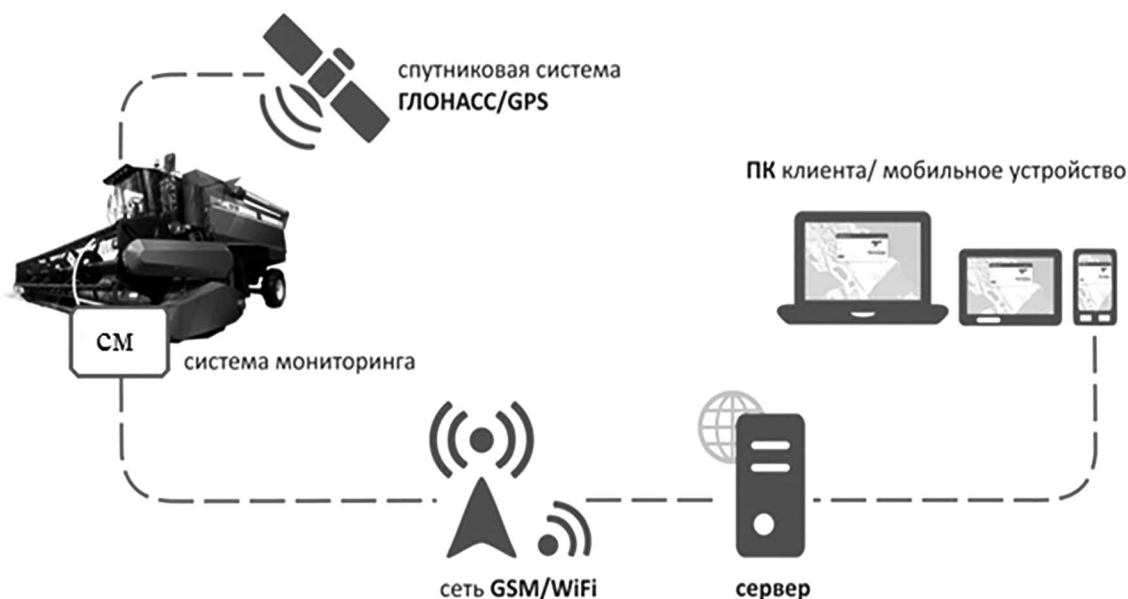
Рис. 1. Принцип работы ГНСС

Изображение, которое пользователь видит на экране или в видеискателе, улавливается специальным светочувствительным сенсором. Сигнал передается от матрицы (сенсора) в процессор, который преобразует его в изображение и выводит на экран, а также сразу записывает на носитель [10].